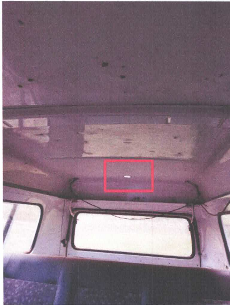
(Buraco no teto)